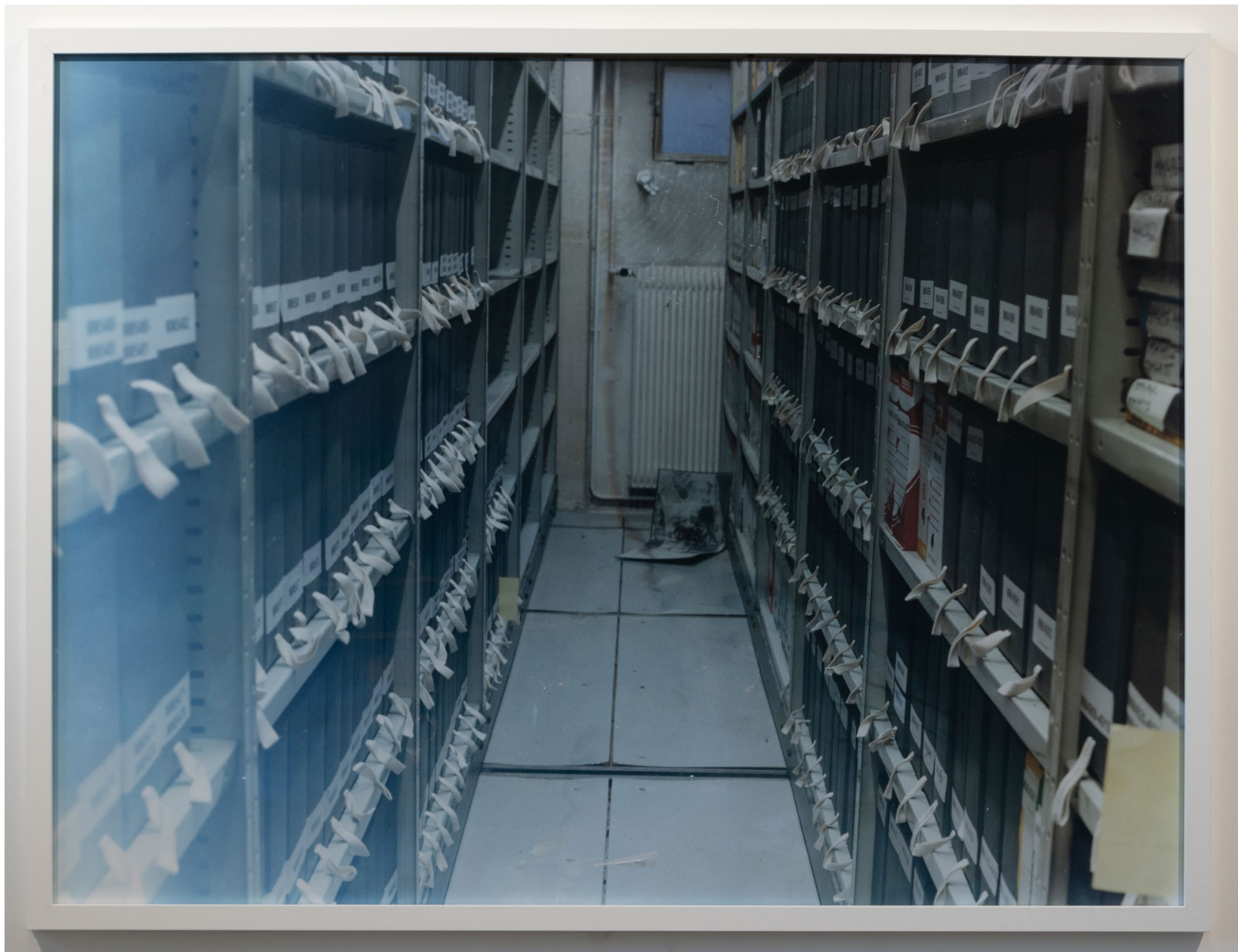
Réserves du Mobilier National, vue d'atelier