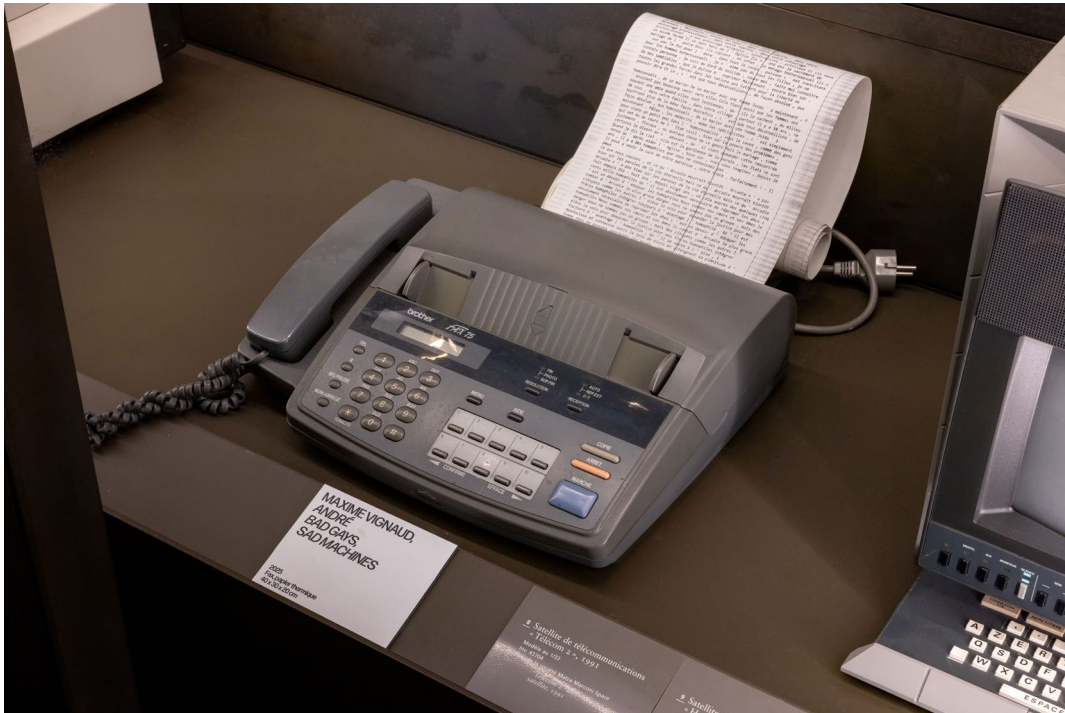
Vue de l'exposition L'atelier du désastre : outils, instruments et autres spectres, 2025, Musée des Arts et Métiers, Paris, France.