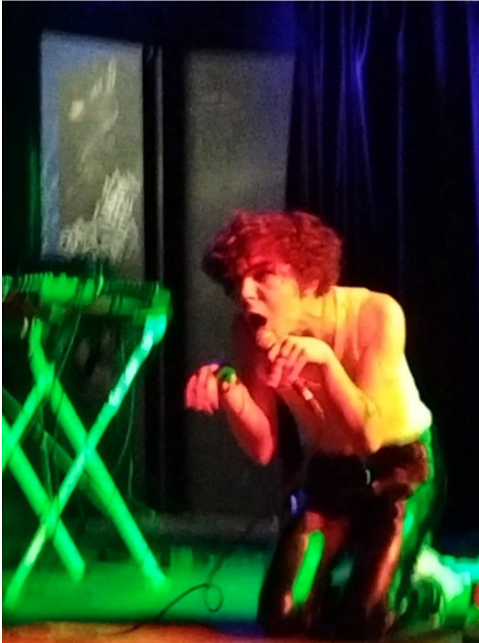
Concert de Bourgeoisie Anale pour le SMC, le Chinois, Montreuil, 2023