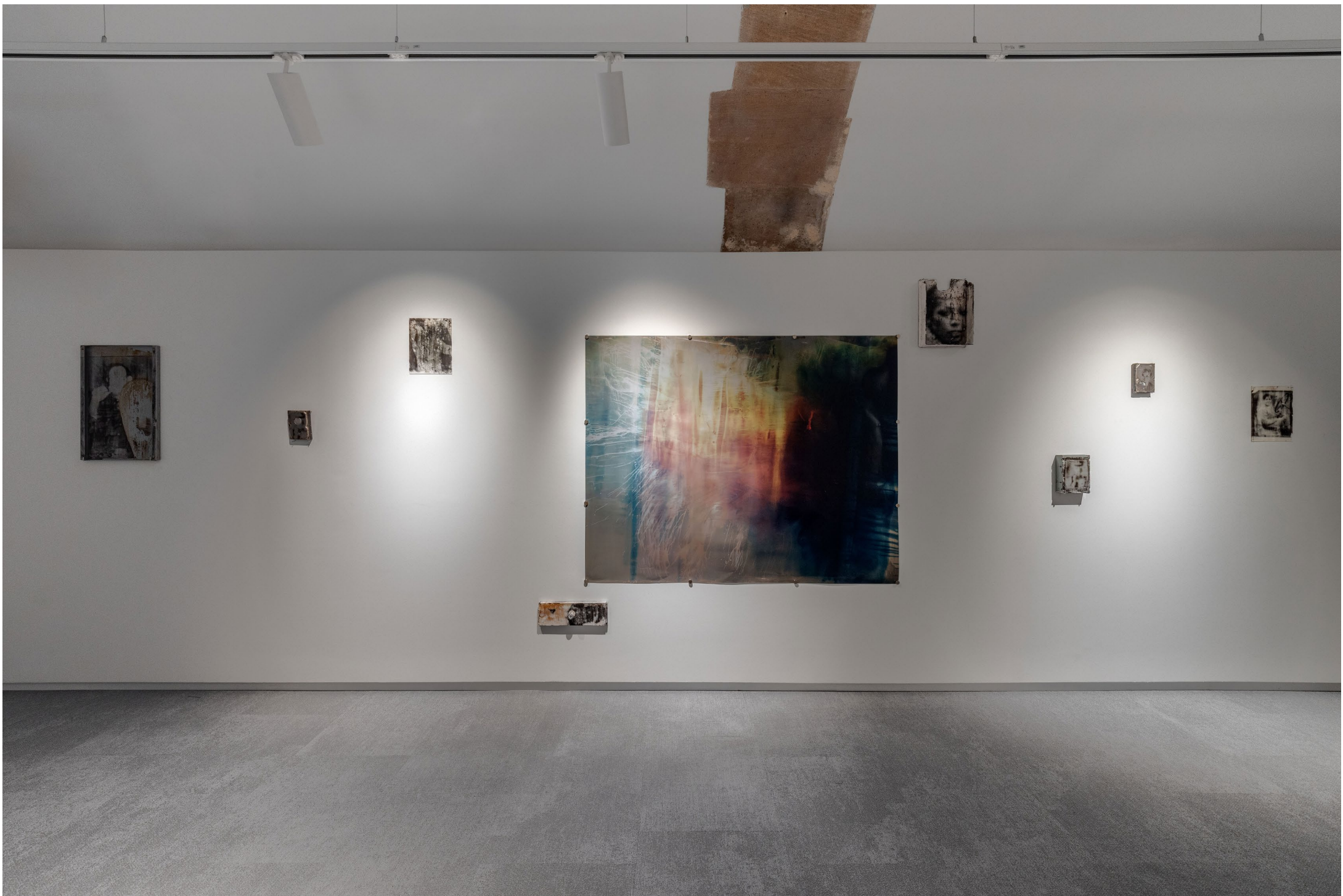
Vue de l'exposition Un soleil à peine voilé, 2025, Galerie de l'Académie des Beaux-arts, Paris, France.