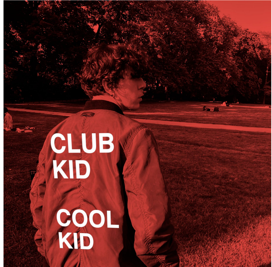
Club Kid Cool Kid (Demo), 2023

Bourgeoisie anale est un projet musical punk solitaire. J'y explore mes deux passions : la bourgeoisie et l'anal.