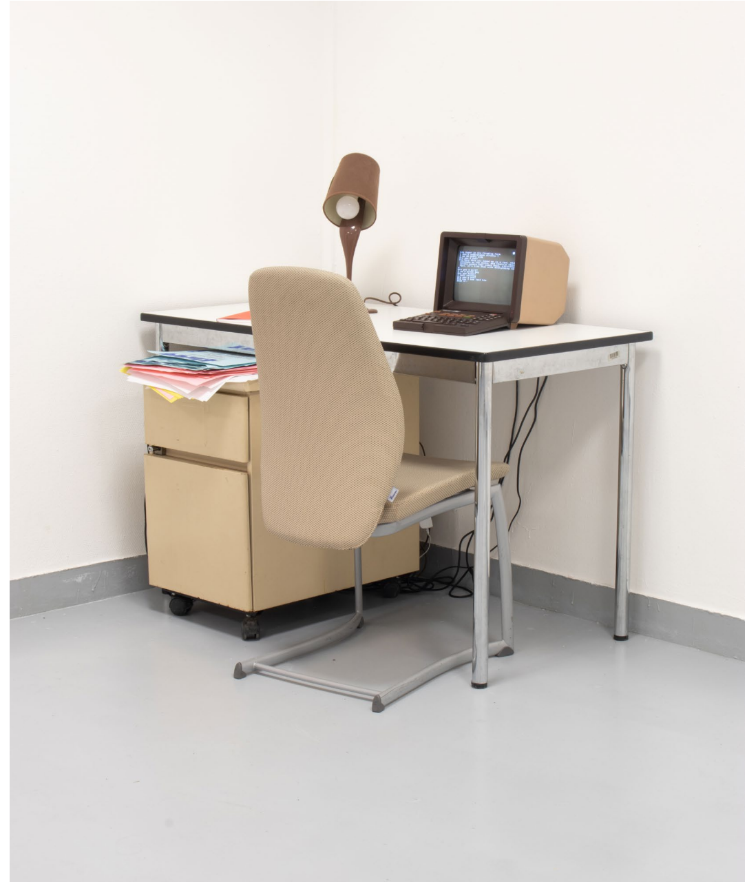
Vue de DNSEP, 2024

Car au bout du fil le programme informatique se prend pour Nicky Crane, un skinhead néonazi, gay, acteur porno et mort du sida en 1993.