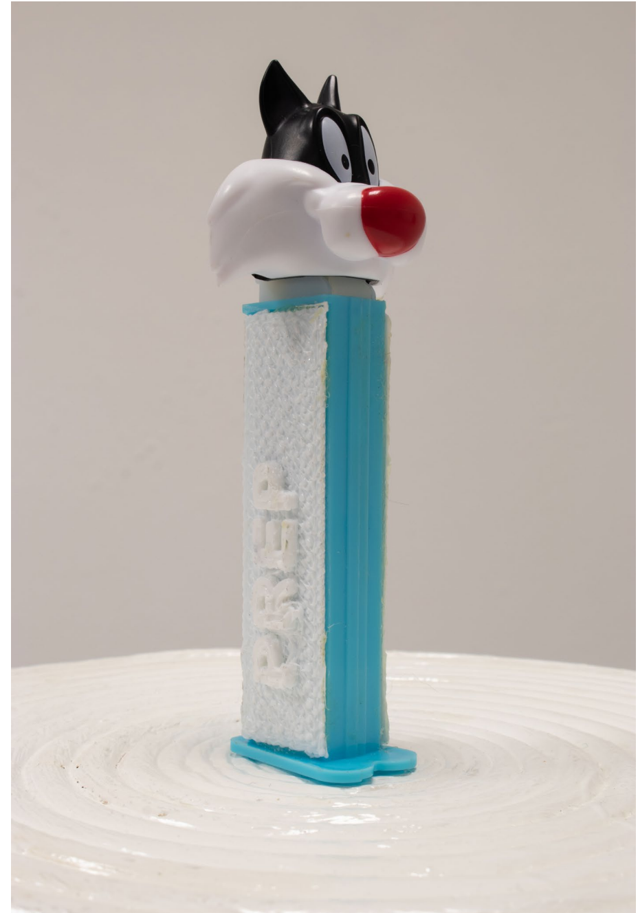
Vue de DNSEP, 2024

PREPZ est une installation constituée d'un tube de bonbons et d'une colonne blanche, vernie. Le détournement du PEZ fait référence à la PrEP, médicament préventif contre le VIH, qui a suscité de nombreux débats réactionnaires au sein des politiques conservatrices, mais aussi d'associations de luttes contre le VIH/SIDA, qui craignent le retour de pratiques comme le barebacking (sexe sans capotes). Dans les années 2010, lors des premiers essais cliniques, le terme Truvada whores apparaît pour stigmatiser les utilisatrices de la PrEP. Cette œuvre aborde ce sujet avec humour en détournant un objet de consommation de masse associé à l'enfance, posé sur une colonne évoquant les décors des saunas gays.